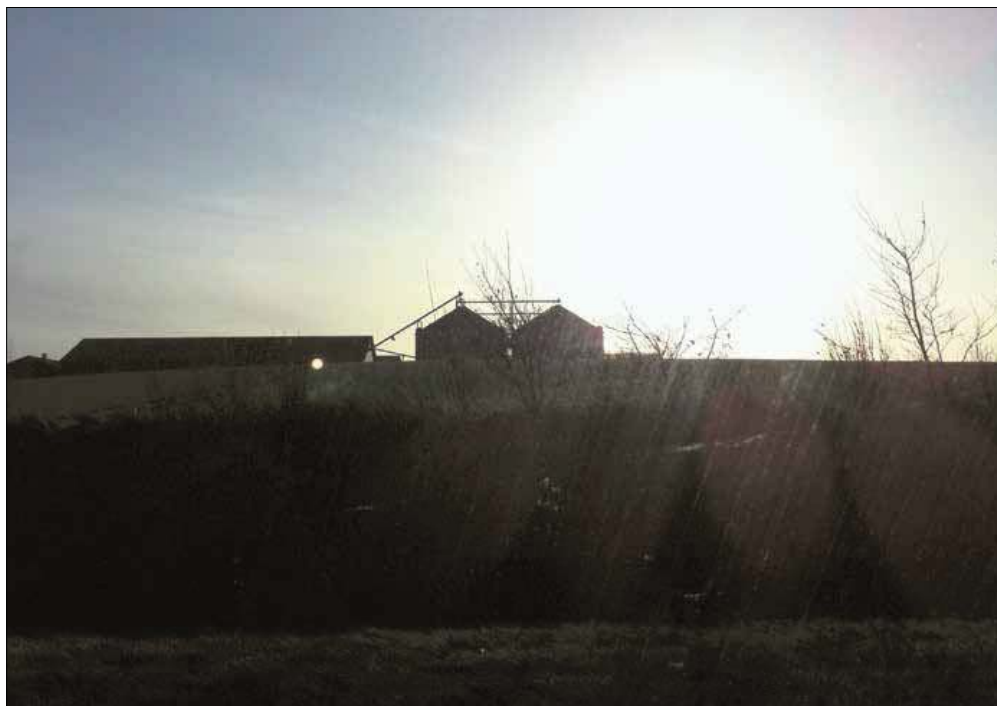
Analysen viser, at en gruppe landmænd betaler i alt 84 millioner kroner for meget i bidrag i forhold til andre landbrugsvirksomheder i en sammenlignelig økonomisk situation.